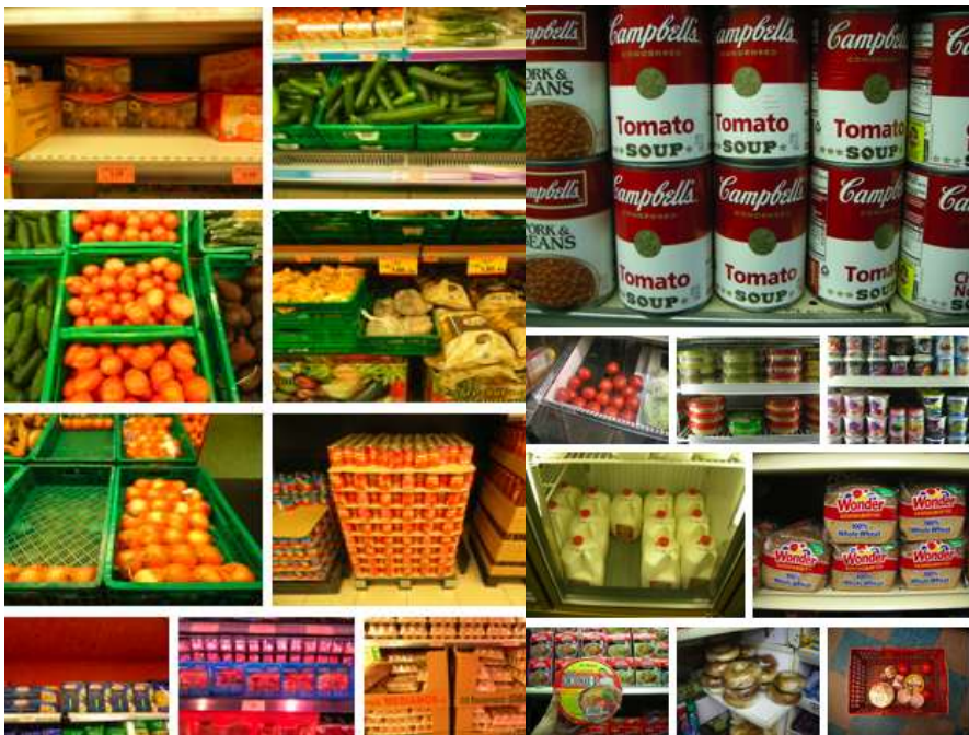
Acción nº 8 "Me alimento" Cartagena-Nueva York