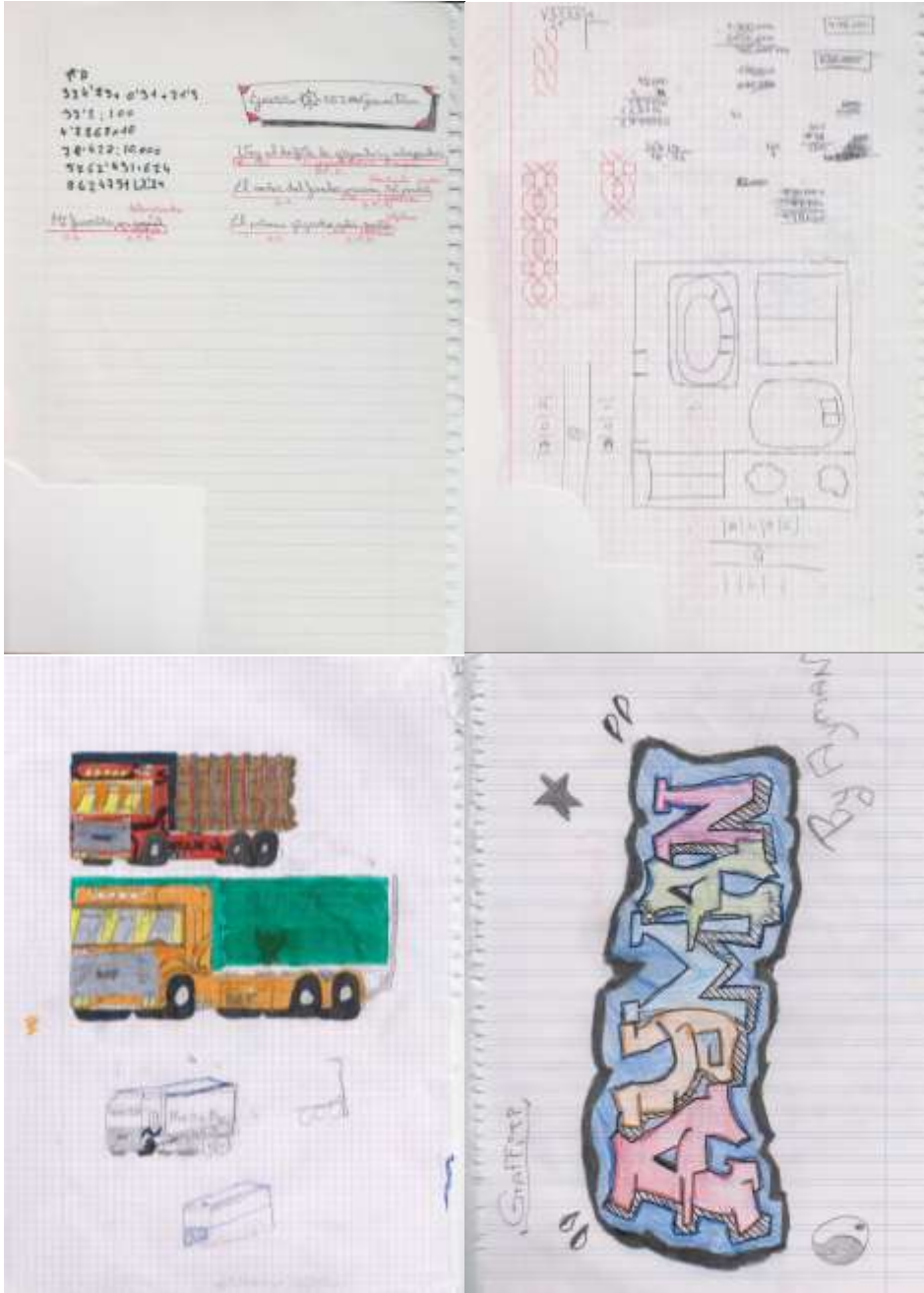
Selección de la colección de 232 hojas de atrás de los cuadernos