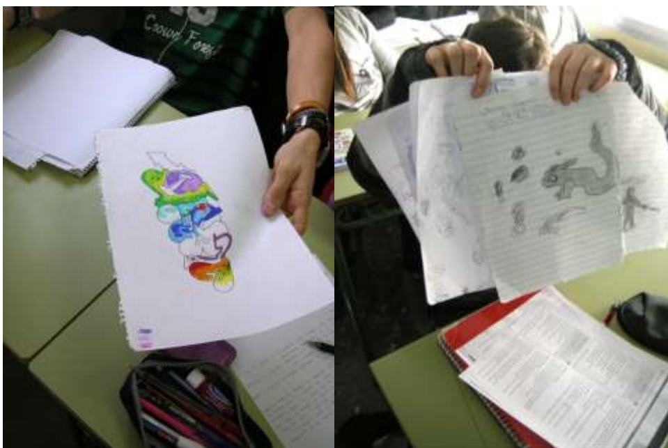
Recopilación de las hojas de atrás

La hoja de atrás del cuaderno de mates era el pequeño reducto de libertad que te quedaba. Los garabatos te ayudaban a luchar contra el aburrimiento que anestesiaba tu cerebro. Caricaturas de profesores y compañeros, mensajitos a tu compañero de al lado, el nombre de un grupo de música o el teléfono de alguien especial ¿Eres capaz de recordar la tabla del siete? Si intentamos hacer memoria sobre lo que aprendimos en la escuela entre los seis y los dieciocho años, puede que encontremos algunos contenidos dejaron poso en nuestra memoria. Pero lo que realmente quedó grabado en lo más profundo de nuestro inconsciente son ciertas pautas de comportamiento que nos enseñaron a pasar por la vida sin hacer ruido, a escuchar y callar, a competir con los compañeros, a no colaborar, a no saltarse las normas, a caminar en silencio sin salirse de la fila, a no cuestionarse la supuesta verdad que los maestros y los libros nos dictaban. Nos enseñaron que aprender es fagocitar sin reflexionar una información que alguien seleccionó, para luego vomitarla en el examen. Equivocarse es malo, no es una oportunidad para aprender.