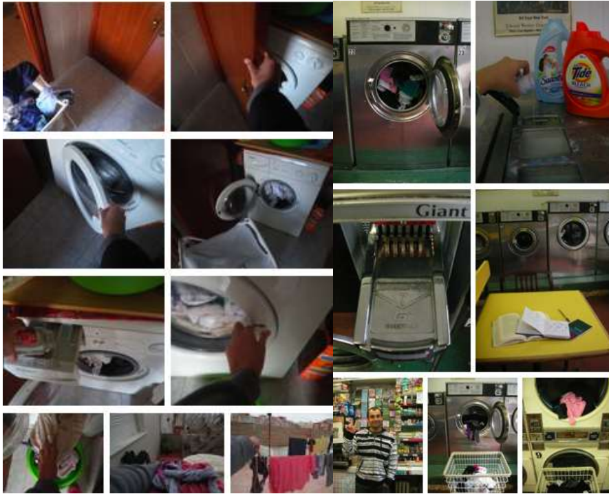
Acción nº. 12 "Colada" Cartagena-Nueva York