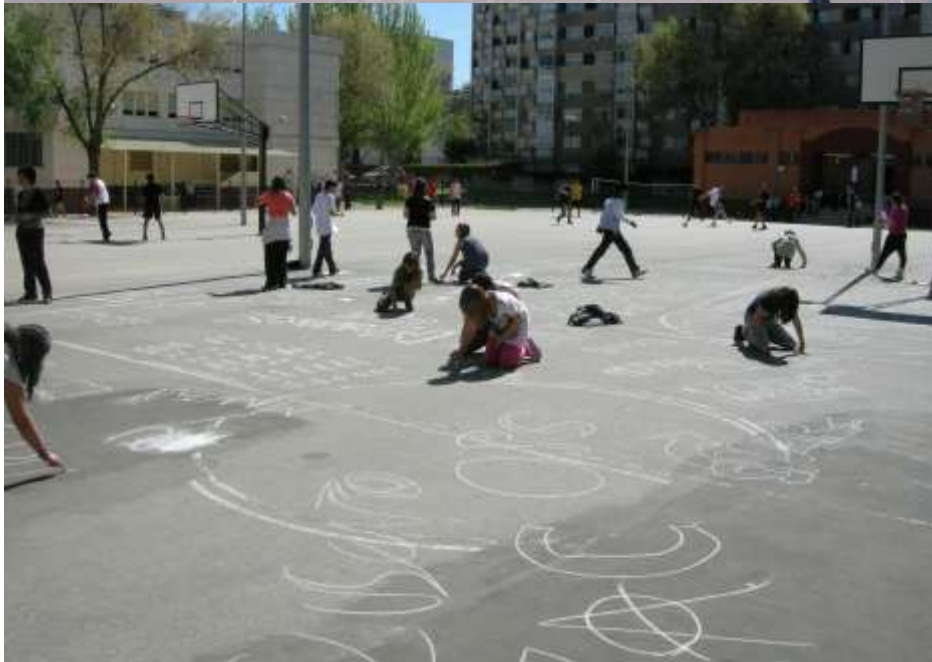
Acción hoja de atrás en el IES Complutense Alcalá de Henares