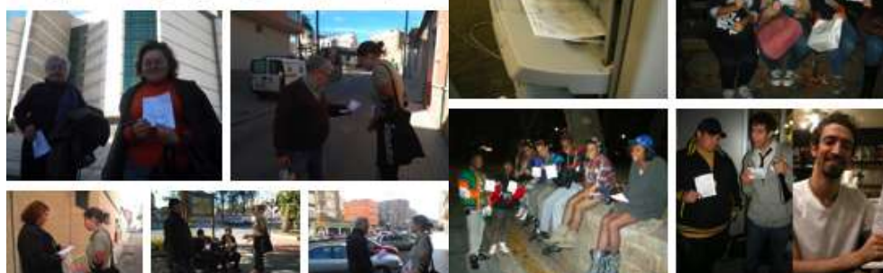
Acción nº 13 "Despedida" Cartagena-Nueva York